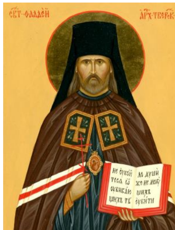
Священномученик Фаддей (Успенский)

В этот светлый день, на рубеже Ветхого и Нового Заветов, родилась Преподобная Дева Мария, предуготовленная от века Божественным Промыслом послужить тайне воплощения Бога Слова - явиться Матерью Спасителя мира, Господа нашего Иисуса Христа. Пресвятая Дева Мария Своей чистотой и добродетелью превзошла не только всех людей, но и Ангелов, явилась живым храмом Божиим, и, как воспевают Церковь в праздничных песнопениях, "Небесной Дверью, вводящей Христа во Вселенную, во спасение душ наших".