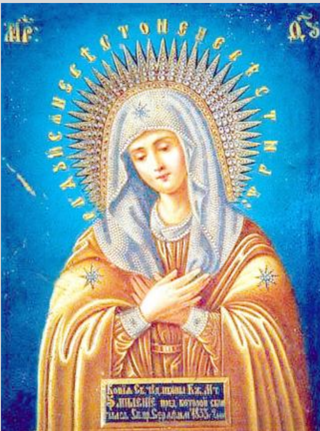
Серафимо-Дивеевский образ Божией Матери «Умиление»

Икона Дивеевского старца и якутский список "Умиления" выполнены по единому канону, что отличает их от другого типа икон, тоже имеющих название "Умиление", но на которых Богородица изображается с младенцем Христом на руках.