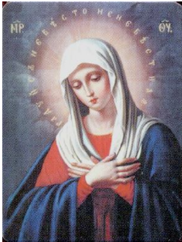
Якутский образ Божией Матери «Умиление»

Радуйся, Евиных слез избавление. Радуйся, древяго змия поправшая; Радуйся, узы греха растерзавшая Радуйся, радость женам несказанная Радуйся, Божия милости дверь. Радуйся, ангелов песнь непрестанная; Радуйся, Богу избранная Дщерь.... Радуйся, света обитель блаженная; Радуйся, Богом избранный удел. Радуйся, скинии Бога священная; Радуйся, добрых сокровище дел.