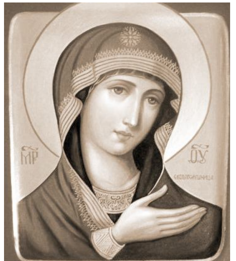
Невская икона «Скоропослушница»

Российского Николая II в доме Ипатьева в Екатеринбурге было обнаружено три списка с этой иконы: два маленьких, писанных на дереве, и один, писанный на полотне, в красках.