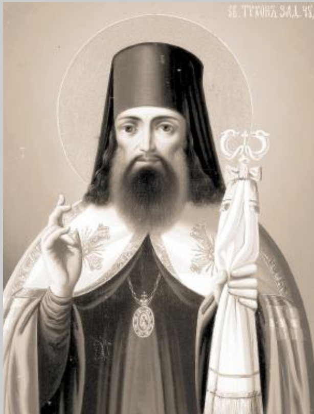
СВЯТИТЕЛЬ ТИХОН ЗАДОНСКИЙ

Болезни наши большей частью происходят от грехов - почему лучшее средство к предупреждению и исцелению от них состоит в том, чтоб не грешить. Великий подвиг - терпеливо переносить болезни и среди них воссылать благодарственные песни Богу. Нас сближает с Богом скорбь, теснота, болезнь, труды. Не ропщи на них и не бойся их. Болезнь хотя плоть твою мучит, но дух спасает.