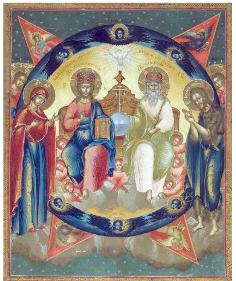
Троица Новозаветная. Тула. Икона XIX века

Иерусалим же был заполнен паломниками, съехавшимися со всех концов империи. И вдруг все услышали неожиданный шум, подобный шуму бури и надвигающейся грозы. В полном смятении люди поспешили к дому апостолов. И там увидели простых галилеян, вдохновенно вещавших на разных языках. Представители самых разных народов без труда понимали их. И обратился к собравшимся апостол Петр: "покайтесь, и да крестится каждый из вас во имя Иисуса Христа для прощения грехов; и получите дар Святаго Духа". Проповедь апостола Петра была очень сильна - в этот день около трех тысяч человек приняли крещение. Так родилась Новозаветная Церковь.