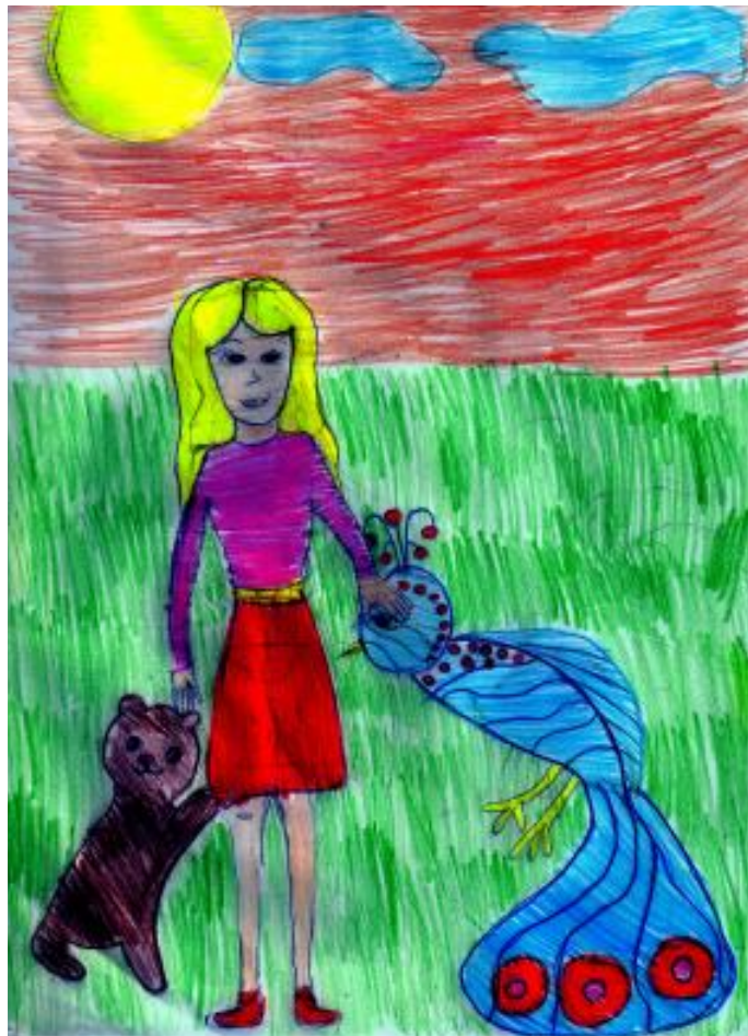
Иллюстрация к рассказу «Про солнце и Пасху»

Редакция «Пути к храму» на своей Детской страничке размещает иллюстрации наших юных читателей - учащихся школы № 23 г. Комсомольска-на-Амуре, в которых они делятся впечатлениями от прочитанных рассказов нашего автора - Татьяны Инюточкиной.