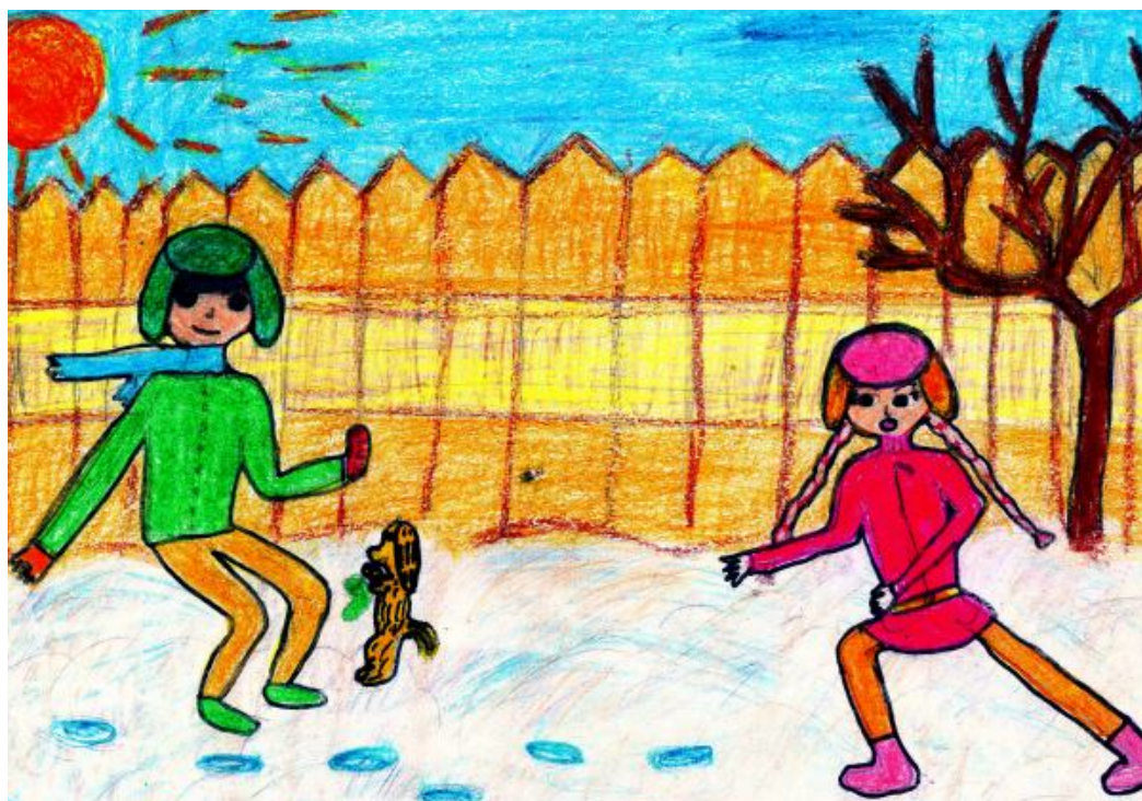
Иллюстрация к рассказу «Масленица»