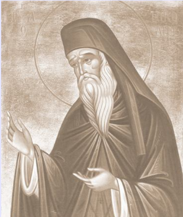
НИКОДИМ СВЯТОГОРЕЦ. "НЕВИДИМАЯ БРАНЬ"

тебя Бог, будет видеть, что ты делаешь добро или пребываешь в добре, если благодушно терпишь, тогда как у здорового дела добрые идут промежутками. Почему, желая перемены своего положения, ты желаешь променять лучшее на худшее?