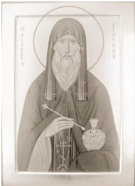
Преподобный Агапит Печерский

Но пока теоретики медицины при анализе этиологических (первопричинных) факторов заболеваний будут оперировать лишь "вредным образом жизни и вредными привычками", "китайскими отравленными продуктами", "нарушенной экологией", "хроническим стрессом" и прочими инфантильным (незрелым) подходом к разрешению ситуации, анализ врачебных ошибок, плачевных и трагических ситуаций для больных будет сваливаться к выводам: «так получилось», «это судьба», «не повезло».