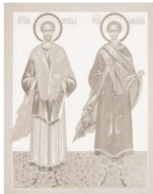
Святые бессребренники Косма и Дамиан

Православная Адыгея. ТК "СОЮЗ": В вашей стране чудо - это когда Бог исполняет чаяния людей, а у нас чудо - когда человек выполняет Волю Божию.