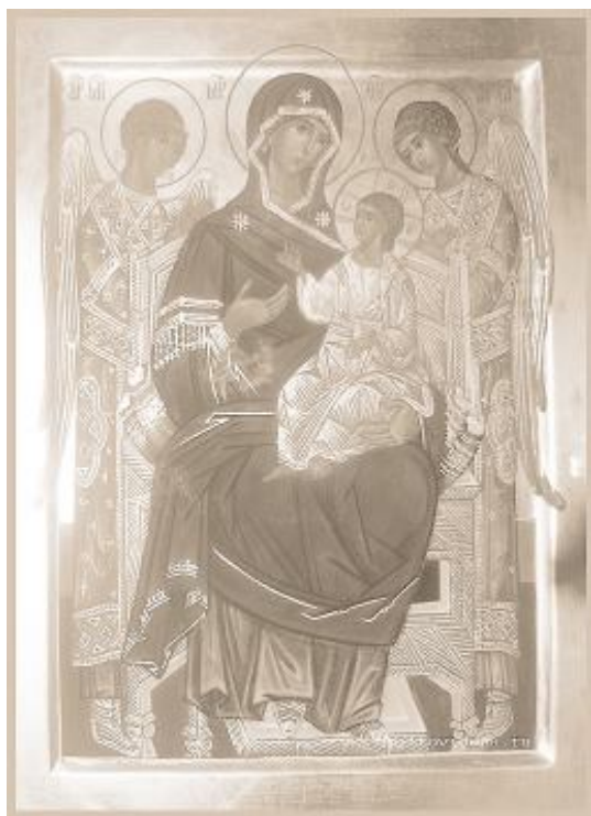
Икона Пресвятой Богородицы «Всецарица»

Существует множество параллелей (сходных путей развития) между возникновением, да и развитием, заболеваний, травм, недугов, немощей и нашей греховной (т.е. ошибочной, нарушающей Божественные Законы мироустроения) жизнью, а так же между Спасением души человеческой и излечением тела и плоти, даже степенью участия в выздоровлении страждущего, врача и Высших сил. Что же общего? Путь оздоровления, как и путь спасения для человека строго индивидуален. Да, есть объединяющие факторы и принципы для определенных установленных диагнозов, они складываются в медицинскую теорию и практику, но они, к счастью, не являются основополагающими.